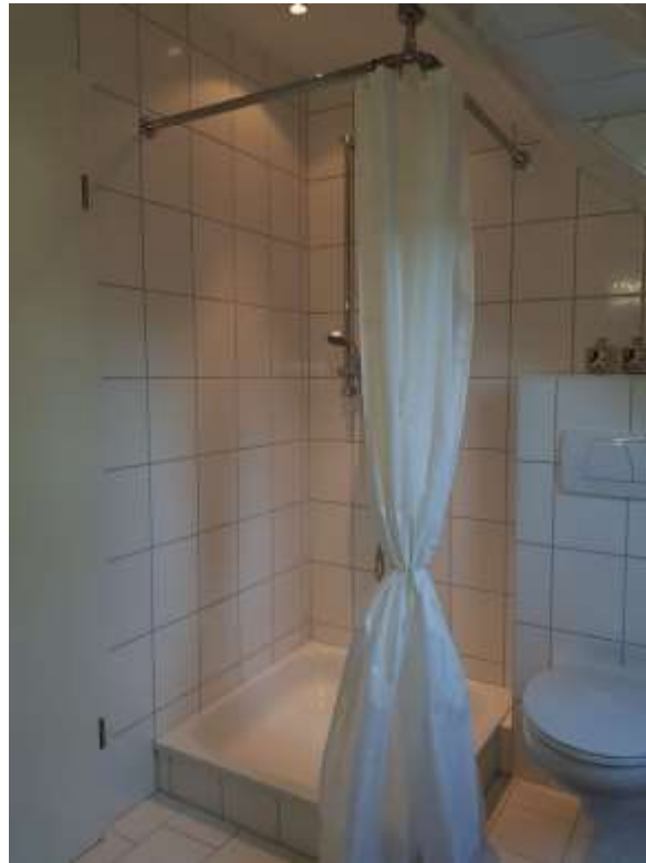
Bad im OG