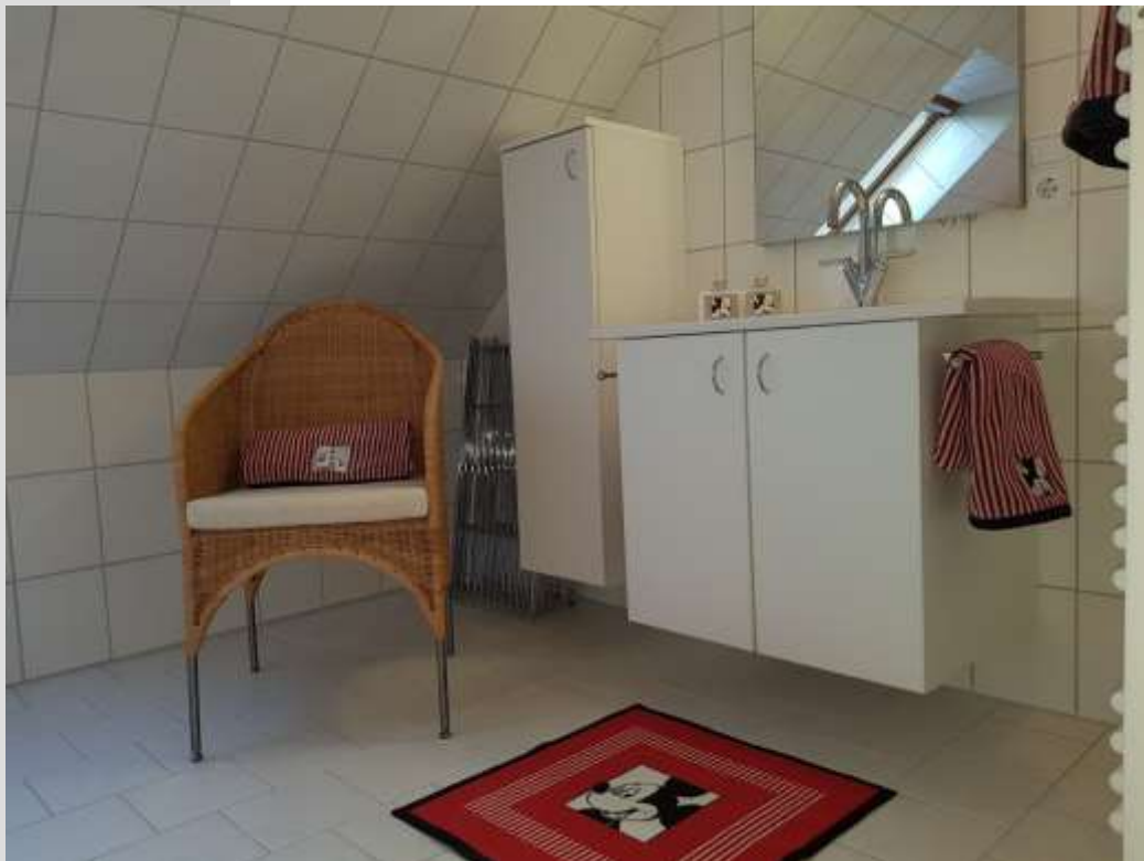
Bad im OG