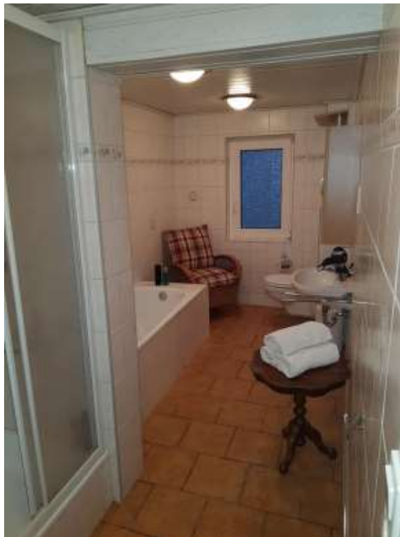
Bad im EG