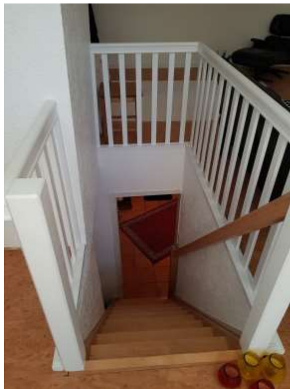
Treppe ins OG